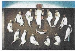
Parrocchia di San Miniato alle Scotte